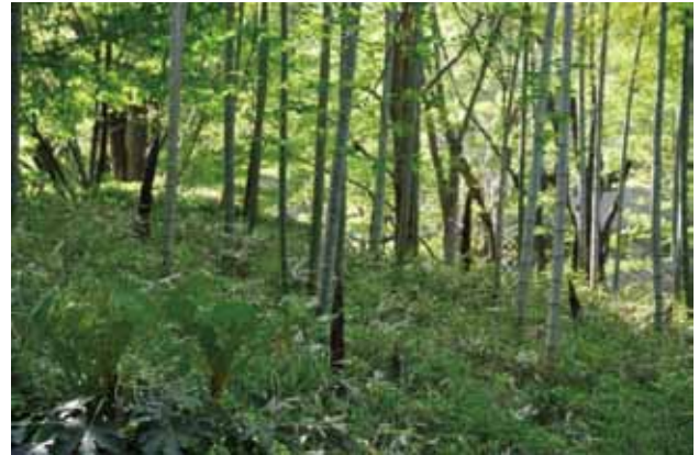
4丁目西の街の竹林