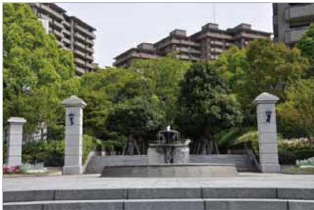
マンション周辺の緑