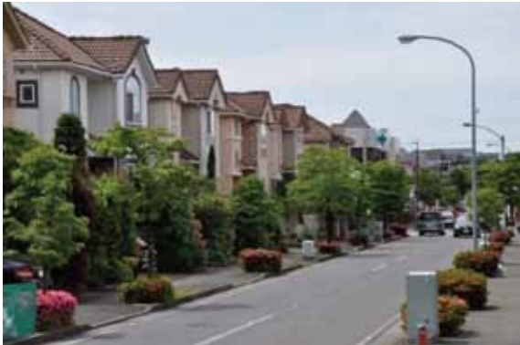
3丁目街並みの洋風住宅