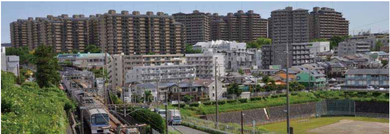
4丁目西・東の街マンション群と緑園都市駅・遊水地