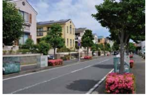
2丁目街並みとツツジ咲くバス通り