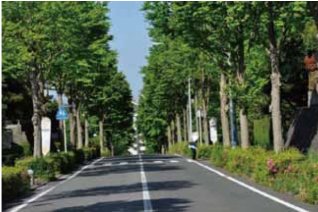
フェリス女学院大学前通り