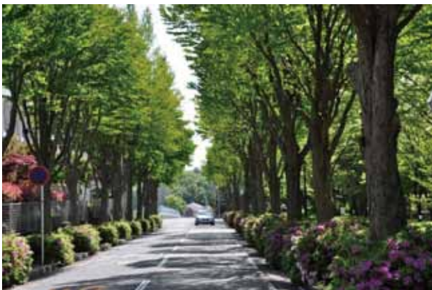
緑園東小学校前通り