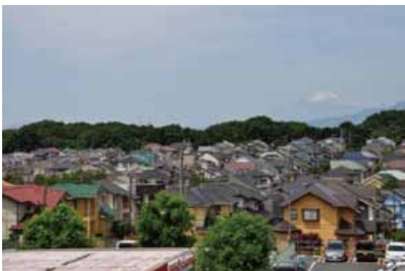
6丁目街並みと富士山を望む