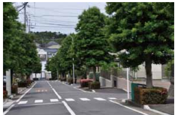
7丁目通りと緑豊かな並木