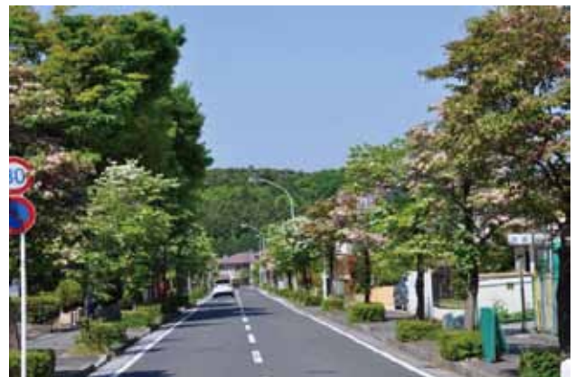
緑園6丁目ハナミズキ通り