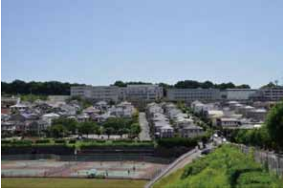
1丁目街並みとフェリス女学院大学校舎