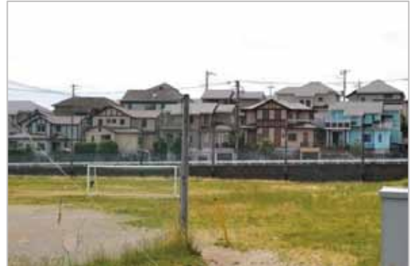
5丁目街並みと中学校予定地